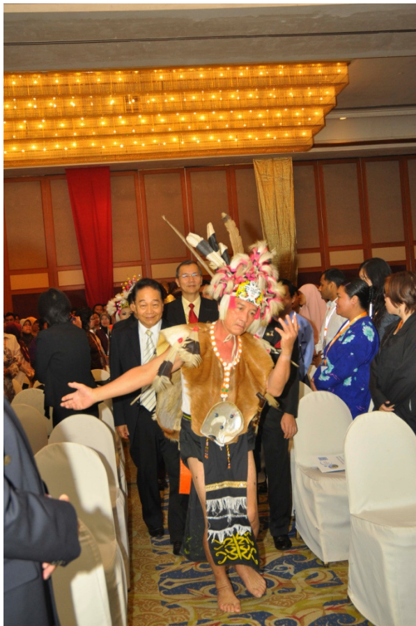
Eröffnung der Konferenz