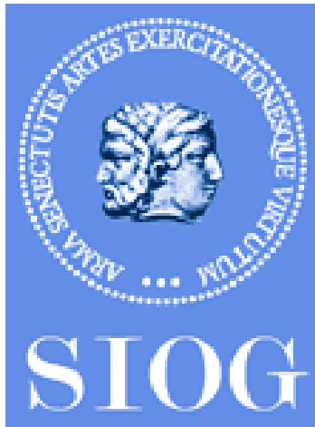
Logo der SIOG (Internationale Gesellschaft für geriatrische Onkologie)